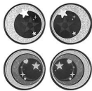
2 Paar Glitzeraugen