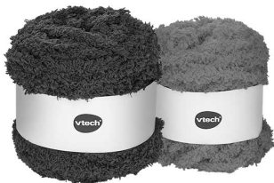
lila- und pinkfarbenes Garn